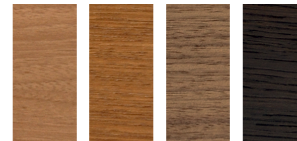
Noce Italiano Biondo